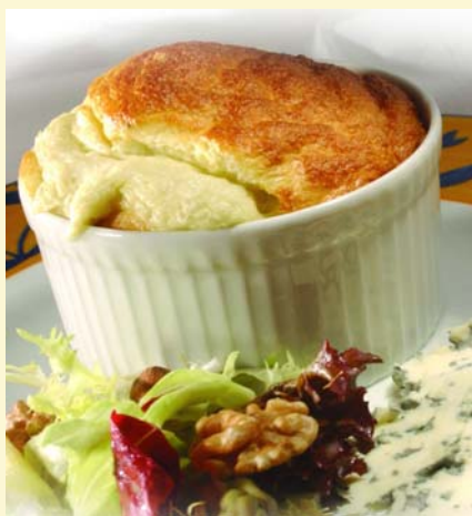
Soufflé à la fourme d'Ambert

« Mon métier consiste à exalter les saveurs, à faire déguster des plats que les personnes ne concoctent pas elles-mêmes. C'est pourquoi, ma carte - qui comprend cinq menus différents - change toutes les six semaines ». Point commun à chacune de ses cartes : il propose toujours plusieurs recettes à la fourme d'Ambert, quelle que soit la saison.